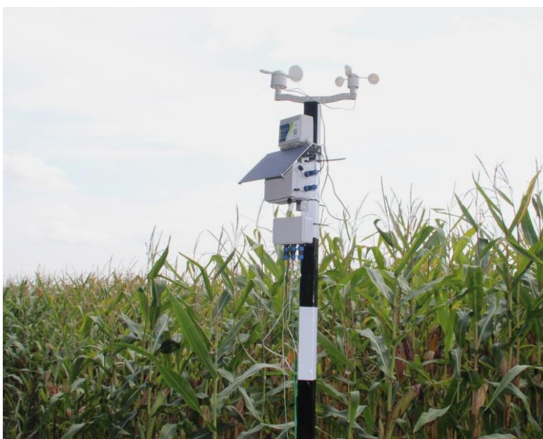
Рис. 4. Полевая метеостанция для ИИС «Умное поле»

Большой интерес вызывает разработка КБНЦ РАН ИИС «Умное поле»: на поле и БПЛА устанавливаются сенсоры для получения оперативных данных о состоянии посевов. С их помощью определяют готовность к посевным работам; отслеживают ход вегетации растений, появление сорняков, болезней и вредителей растений; планируют агротехнические мероприятия; принимают эффективные решения по управлению ресурсами предприятий. На протяжении 2022–2024 гг. при создании ИИС «Умное поле» на посевах кукурузы рядом с полевой метеостанцией подключали стационарные датчики для измерения \text{CO}_2 , солнечной радиации, содержания в почве азота, фосфора, калия, с помощью которых контролировали вегетацию растений и принимали соответствующие решения (рис. 4).