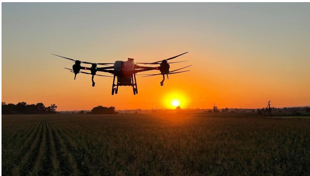
Рис. 3. Опрыскивание посевов агродроном DJI Agras T40