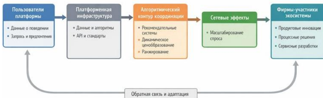
Рис. 1. Платформенная экономика как механизм трансляции спроса в инновационную активность

Для систематизации теоретических положений и наглядного отражения механизмов функционирования платформенной экономики целесообразно представить обобщенную схему трансляции пользовательского спроса в инновационную активность фирм в рамках цифровых экосистем. В отличие от традиционных рынков, где связь между спросом и инновациями носит опосредованный характер, платформенные модели формируют прямые алгоритмические и инфраструктурные каналы воздействия. Это позволяет рассматривать платформу не только как посредника, но и как активный координирующий механизм экономического взаимодействия. В этой связи на рисунке представлена концептуальная модель платформенной экономики как механизма преобразования данных о спросе в инновационные решения хозяйствующих субъектов.